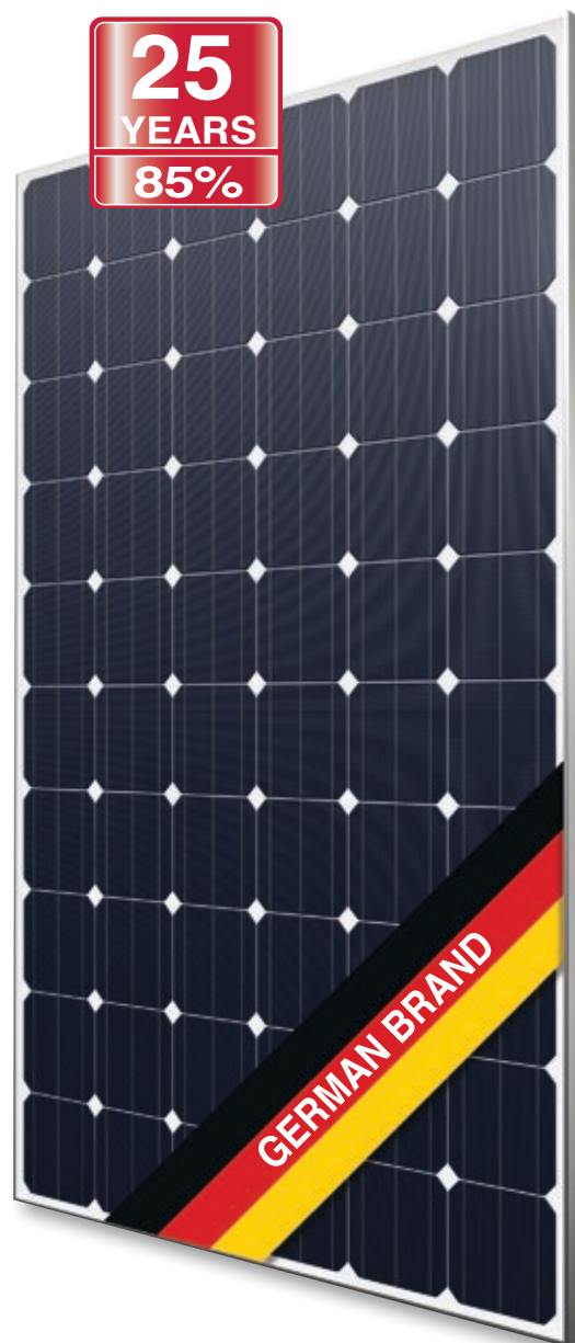
Abb. ähnlich 60M156DE150505A

Hochwertige Anschlussdose und Steckersysteme